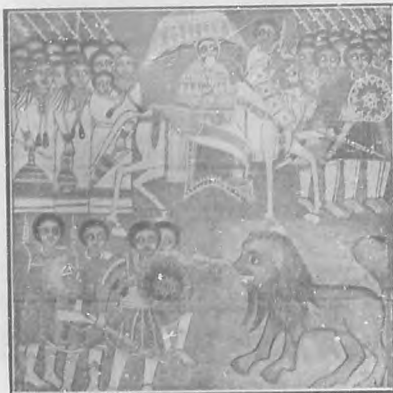
UNA CAZA AL LEON