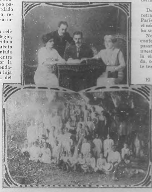
EL MAGISTERIO EN CAIBARIEN.—Las aulas superiores de la Escuela "Ricardo de la Torre" que realizaron una excursión instructiva. El director y los tres maestros que organizaron la excursión.

Entre las excursiones instructivas que realizan las Escuelas del Distrito de Caibarién merece citarse la llevada á