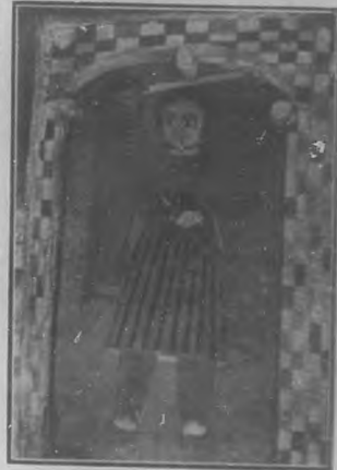
EL ARCANGEL SAN MIGUEL

Los conocimientos de la perspectiva, el respeto de las