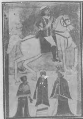
EL AUTOR PINTADO A CABALLO

Basta decir que todas las pinturas se parecen, y sólo se sabe lo que representan por el lettero que detrás del cuadro el autor ha trazado con cal.