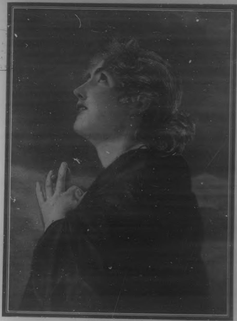
EXTASIS.—Cuadro de Max Levis.