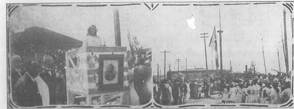
EL 20 DE MAYO. Momentos de ser izada en la Alameda de Paula la bandera cubana, costeada por los niños de la Escuela del Distrito. — Fiesta celebrada por la Asociación de Proprietarios e Industriales y vecinos del Distrito Este, que obtuvo el merecido lucimiento.