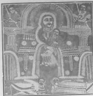
LA VIRGEN DE LA SILLA

En una iglesia cerca de Asmara se encuentran algunas pinturas que quieren representar al general Baldissera y á varios oficiales, en otra iglesia, el general Baratieri en la toma de Kassala.