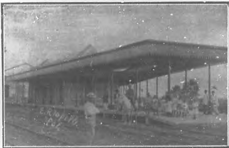
Nueva estación del F. C. de la The Cuban Central en Cifuentes próxima á inaugurarse y que forma el entronque con la nueva línea de San Diego del Valle y la de Placetas y Caibarién.

Nuestras fotografías dan idea de lo que fué el acto que