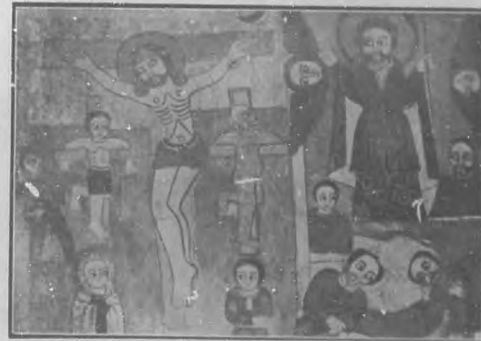
HISTORIA DE LA PASION